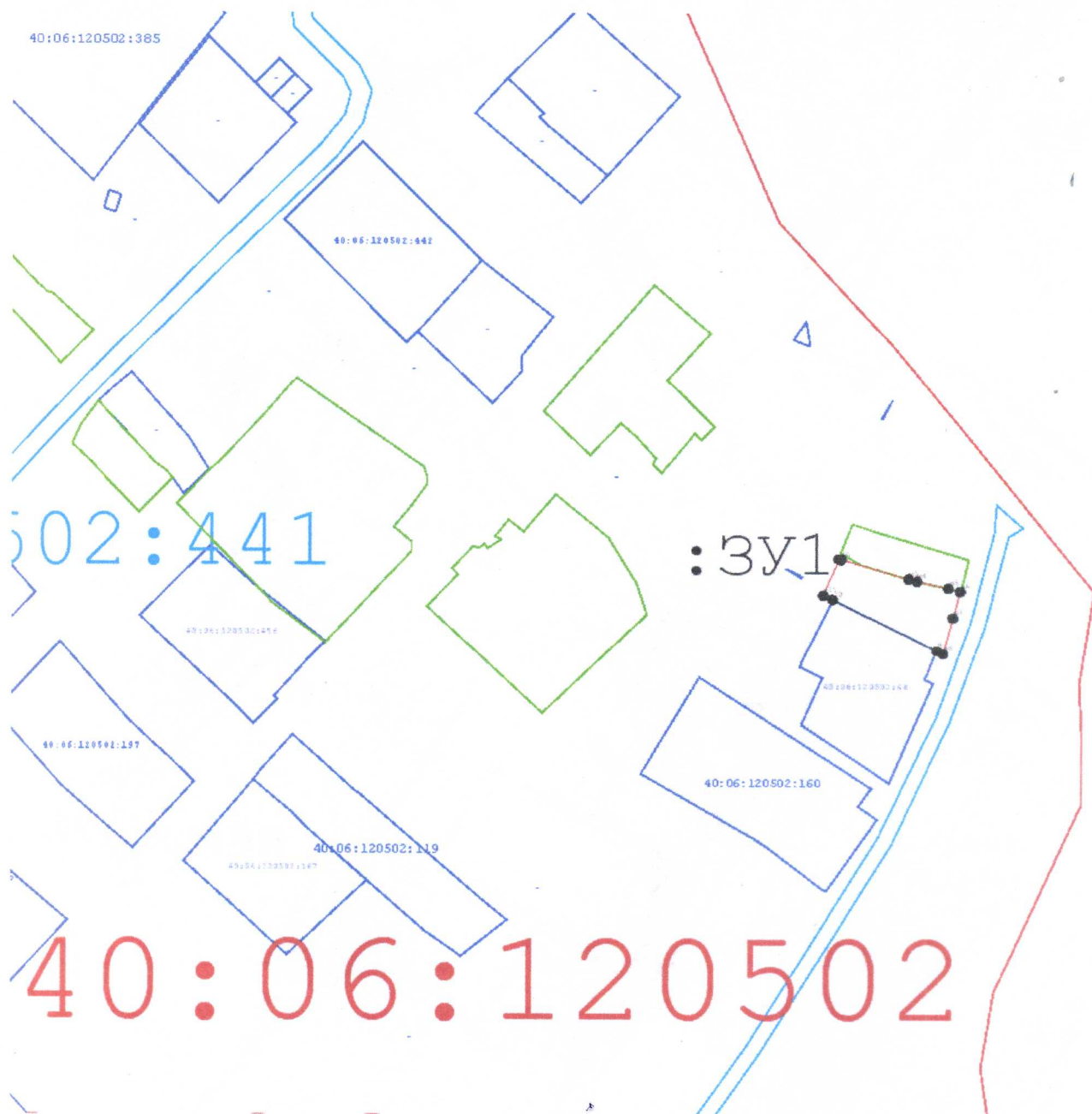
Схема расположения земельного участка на кадастровом плане территории